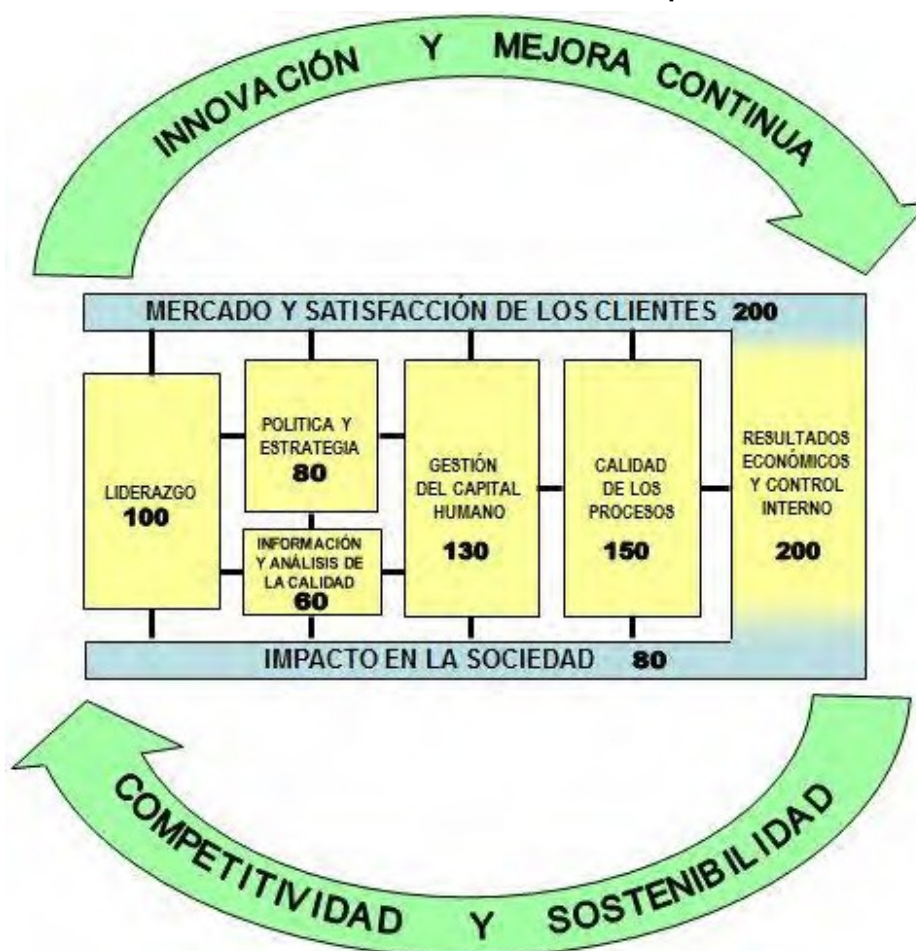
Fig. 1. Modelo de Excelencia del Premio Nacional de Calidad de la República de Cuba

Los criterios que conforman dicho Modelo: